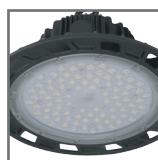
źródło światła LED