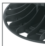
radiator odprowadzający ciepło