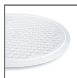
wymienne soczewki 110°/90°